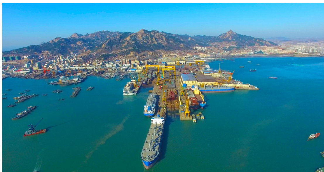
黄海造船有限公司全景

其中重点骨干企业黄海造船有限公司建造交付的“渤海金珠”大型客滚船是我国第一艘具有完全自主知识产权的150米以上大型客滚船；2019年交付的“中华复兴”为国内建造的亚洲最大客滚船；出口法国的400箱客货船“Aranui5”（阿拉努伊5）被外媒称为“中国为国际市场建造的第一艘豪华邮轮”，其大型豪华客滚船、大型集装箱船建造已形成国际化、批量化、系列化和专业化。