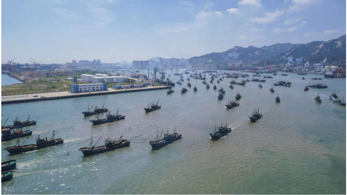
石岛渔港千帆竞发

石岛渔港于2020年9月被农业农村部批准为第一批国家级海洋捕捞渔获物定点上岸渔港。良好的自然条件，完善的配套设施，使石岛渔港逐步成为集渔港避风、渔业生产休整、渔需供应补给、水产品流通与信息服务等功能于一体的综合性大型渔业产业化基地。