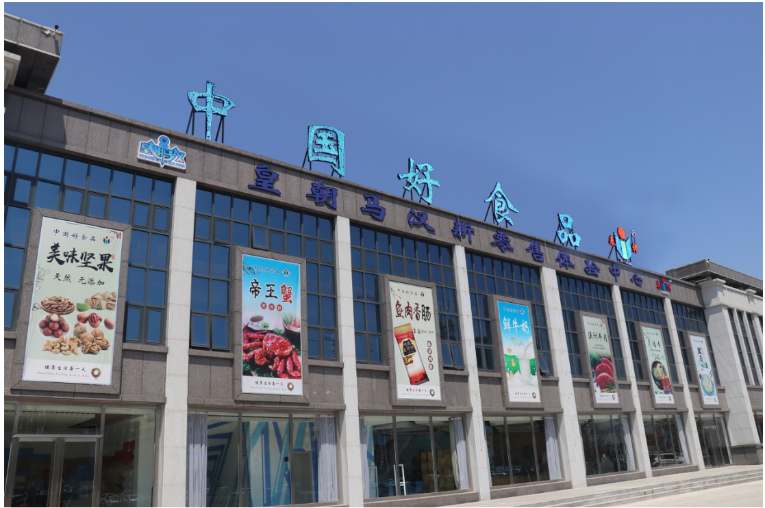
泰祥水产食品有限公司

立足良好的产业基础，当地把预制菜产业作为推动新一轮海洋食品转型升级的重要契机和突破口，众多本土企业正以“八仙过海”之势，在这一新赛道上各显其能，推动预制菜产业发展蹄疾步稳，茁壮成长。