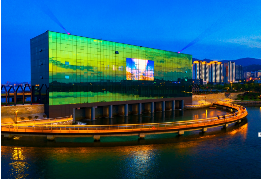
凤凰湖城市书房夜景