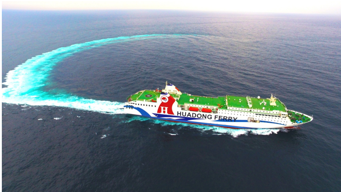
往返于石岛与仁川的“华东明珠”客货班轮

近年来，当地深入挖掘港口周边腹地潜力，积极拓展大件装备运输、包船出口等新业务，以及保税物流、跨境电商等新业态，推动石岛港由单一交通物流平台向多元产业集聚功能转变，做足以港兴区、港城共荣的文章。