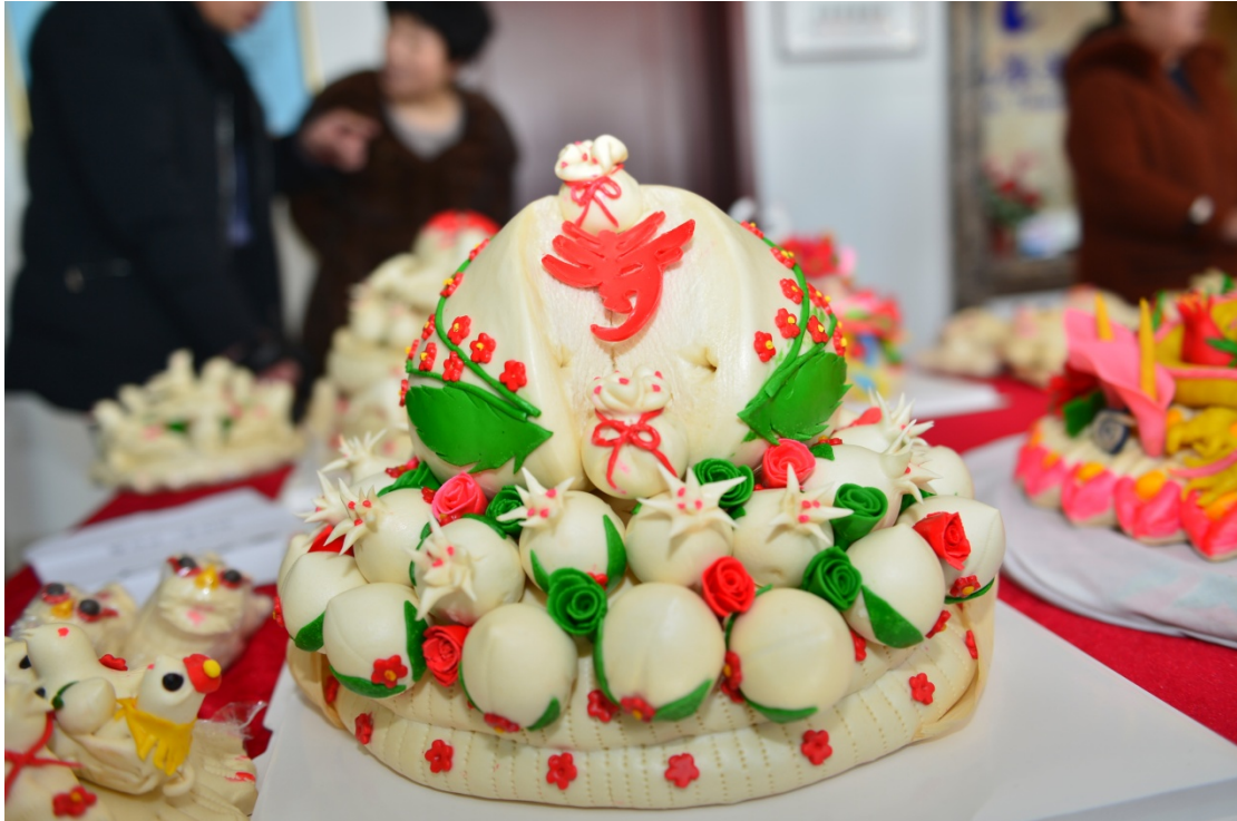
当地妇女制作的花饽饽

花饽饽不仅用于食用，而且更多用于庆祝和祭祀。无论是逢年过节还是人生中经历的满月、百岁、婚宴、寿宴等重要场合都会看到各种造型各异、栩栩如生的“大花饽饽”，有如意吉祥、祈福祛灾的美好之意，胶东花饽饽也叫面塑或捏面花，其历史悠久，花样繁多。