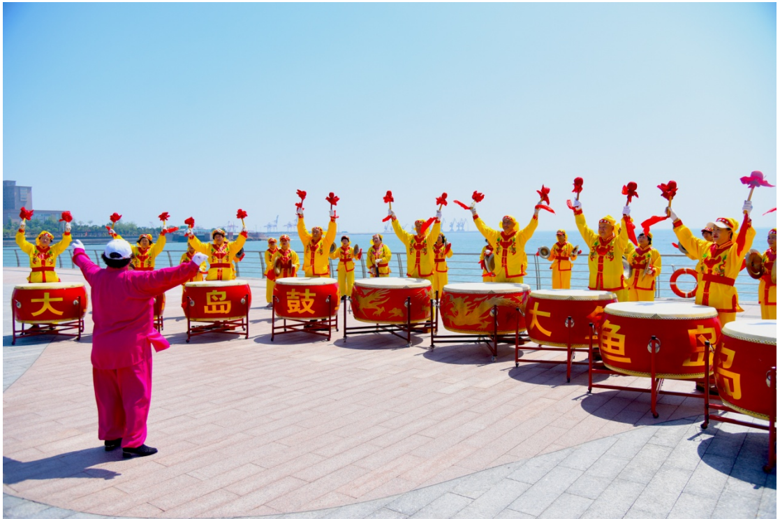
石岛渔家大鼓表演

上世纪 90 年代初期，当地文化站壮大锣鼓队伍，并对大鼓的曲调进行了改进和完善：一是变单打为群打；二是去掉了每套的手锣、小钹等小件，增加了锣、钹各一的组件；三是根据时代精神，加强了欢乐气氛；四是改二钹指挥为一人总指挥，从而使锣鼓的音乐性进一步发展和完善，阵容更加宏大，气势更加壮观，表现出当地人们在与风浪斗争中坚韧不拔的意志和勇于拼搏的信念。