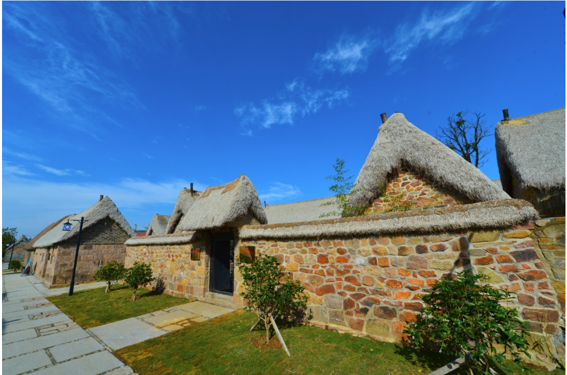
谷牧旧居和谷牧传记馆

谷牧旧居先后被批准为“威海市级文物保护单位”“威海市爱国主义教育基地”“山东省党史教育基地”。