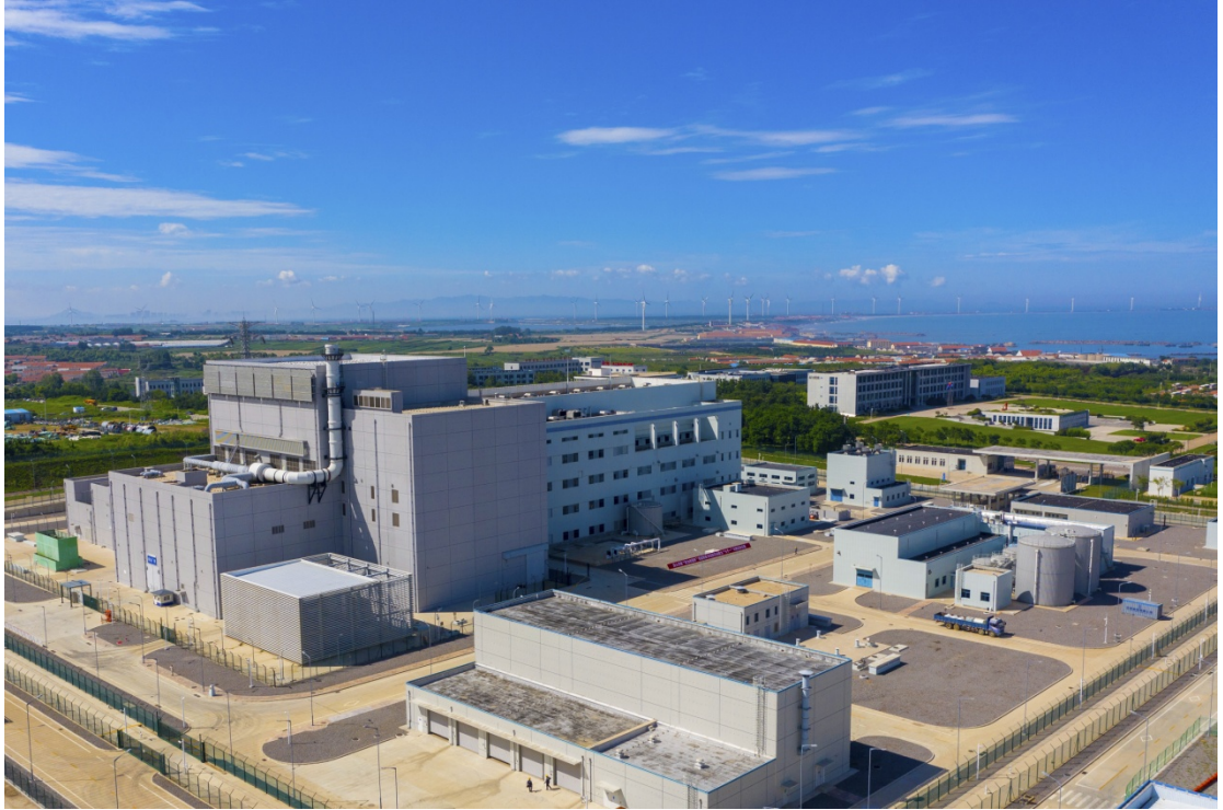
华能石岛湾核电站

当地坚持做大能源供给线、做长衍生应用线、做强科技人才线、做实装备产业链、做优服务保障线的“五线并进”发展战略，引进更多上下游产业链项目，推动更多本土企业进军新能源领域，打造一核引领、多能衍生的“国际能谷”。