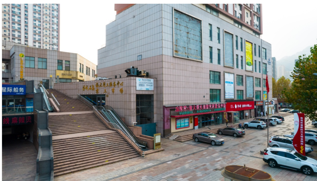
荣成石岛海上用工服务中心·零工市场