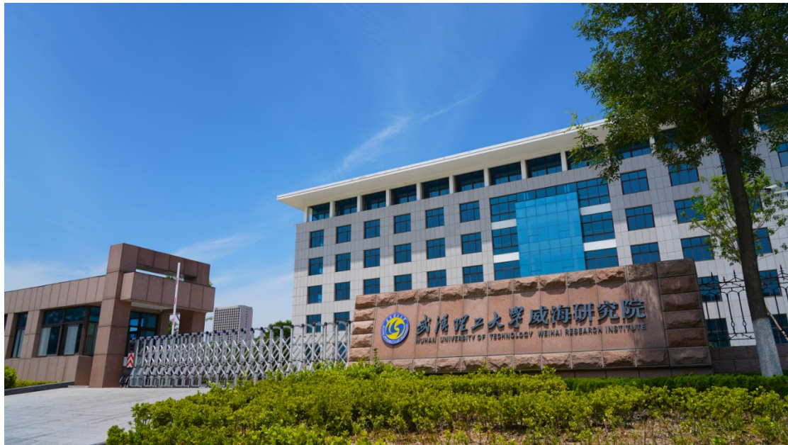
武汉理工大学威海研究院