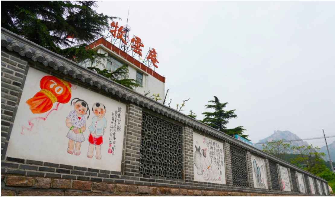
牧云庵墙壁渔民画

该村有 80 多幅作品参加了市、省级及全国的美术画展，有 20 件作品获奖，有 20 多幅年画由人民美术出版社出版，有 400 多件美术作品在各级报刊上发表。剪纸在该村也有悠久历史。随着经济的发展，他们在追求物质生活美的同时，也在追求着精神生活的美，把舞文弄墨当作一件高雅事。