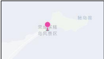
石岛管理区充电站布局图