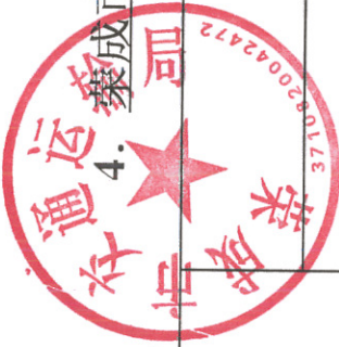
4. 荣成市交通运输局2022年度行政征收征用情况统计表