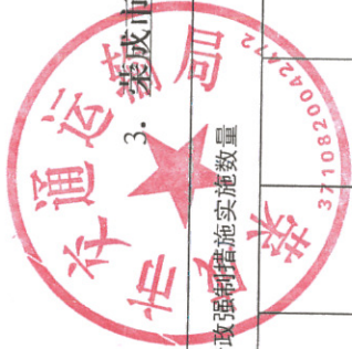
3. 荣成市交通运输局2022年度行政强制执行情况统计表