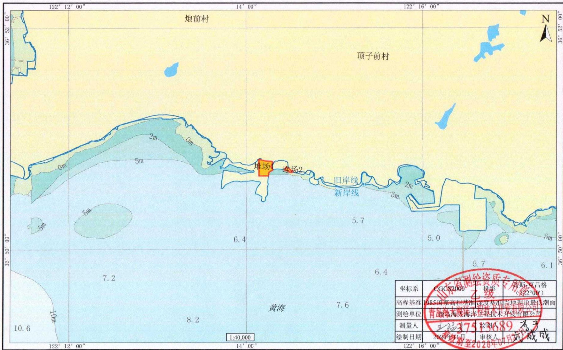
威海荣成扬帆船舶制造有限公司船厂建设项目用海调整（改建堆场）宗海平面布置图